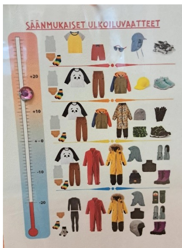
Erilaiset toiminnanohjaukuvat edistävät lapsen itseohjautuvuutta