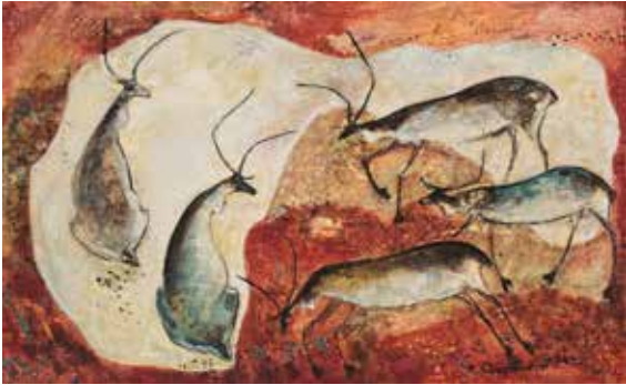
Reidar Särestöniemi: Porot pälvissä II, 1959 Kirsi ja Keio Eerikäisen Taidesäätiö sr.